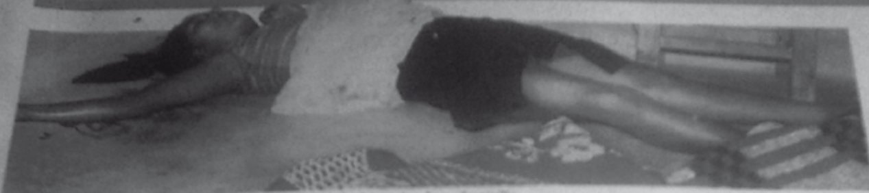
ASÍ FUE ENCONTRADO el cuerpo de Ricarda Toto, al interior de su domicilio.