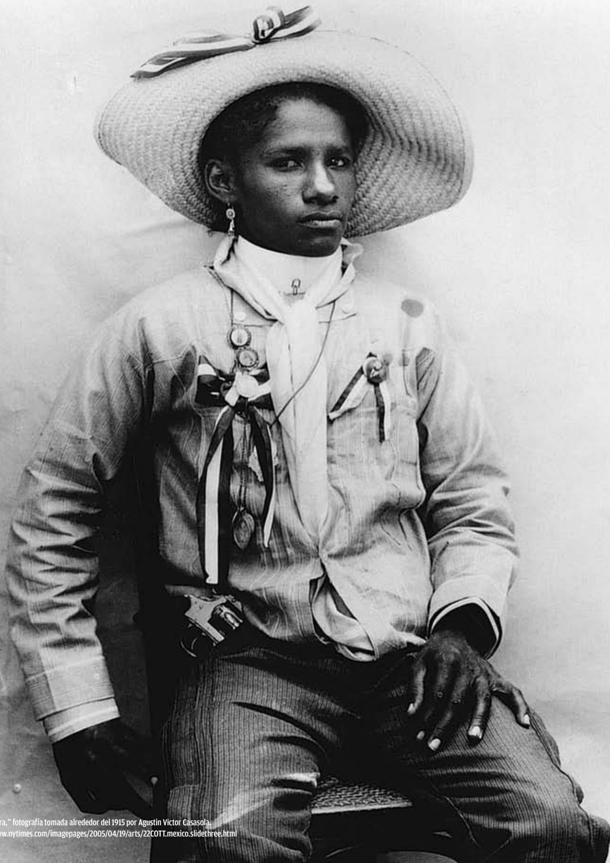
"Soldadera," fotografía tomada alrededor del 1915 por Agustín Víctor Casasola. http://www.nytimes.com/imagepages/2005/04/19/arts/22COTT.mexico.slidethree.html