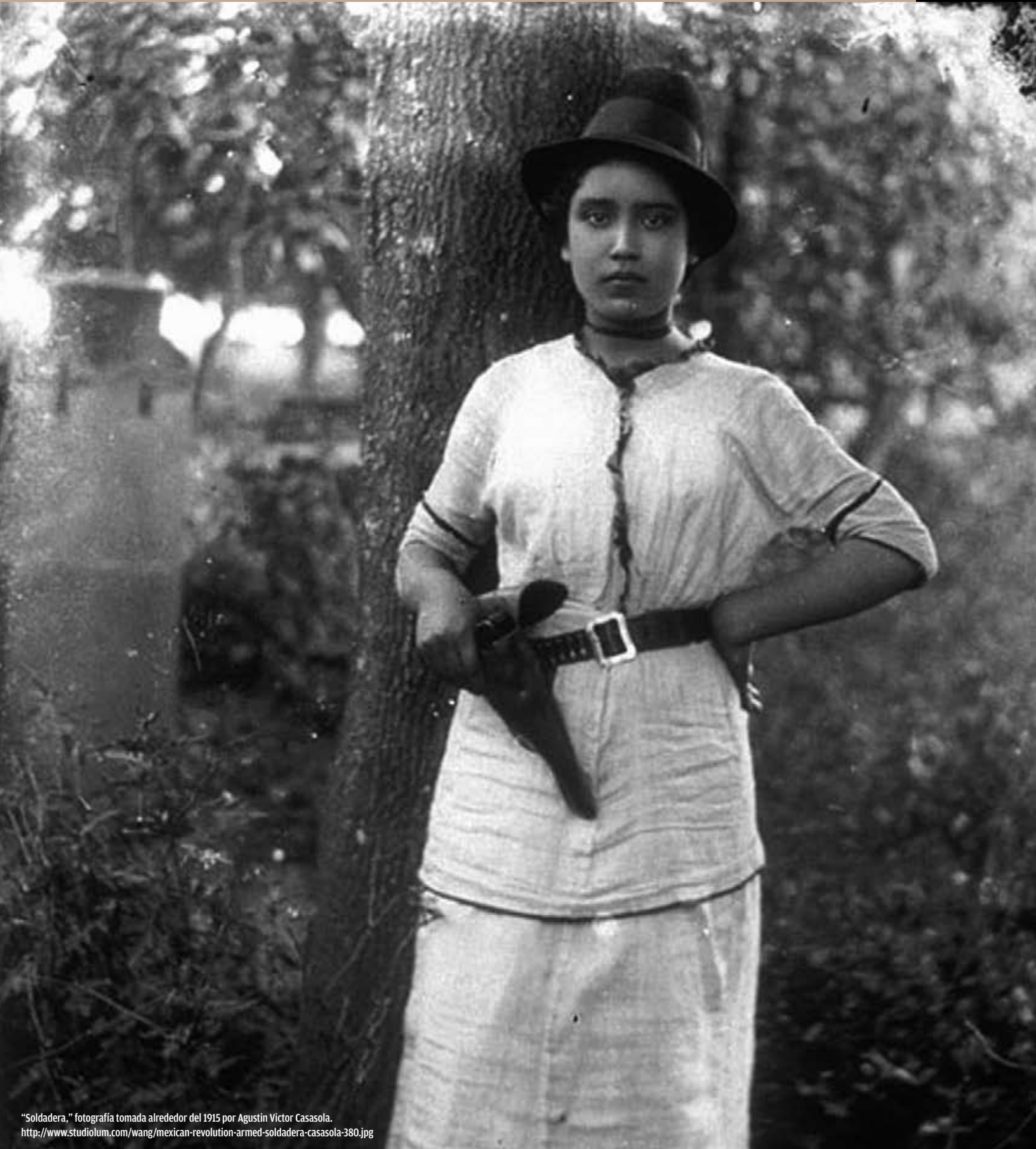
"Soldadera," fotografía tomada alrededor del 1915 por Agustín Víctor Casasola. http://www.studiolum.com/wang/mexican-revolution-armed-soldadera-casasola-380.jpg